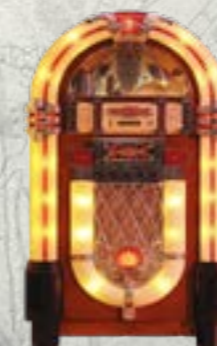
Mr. Sandman Electro Swing Mix