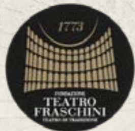
Pavia @Teatro Fraschini