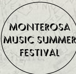
Champoluc (AO) @Monterosa Music Summer Festival