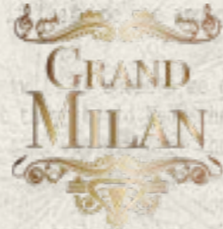
Milano @Grand Milan