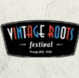
Inzago (MI) @Vintage Roots Festival