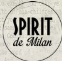
Milano @Spirit de Milan VEDI