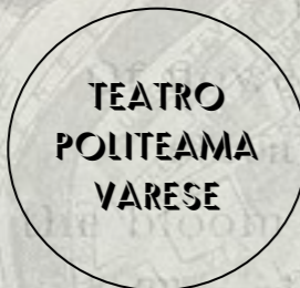
Varese @Teatro Politeama