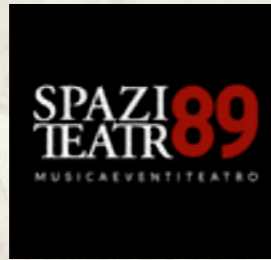
Milano @Teatro Spazio 89