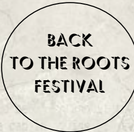
Samedan (CH) @Back to the Roots Festival