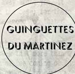
Cannes (FR) @Guinguettes du Martinez