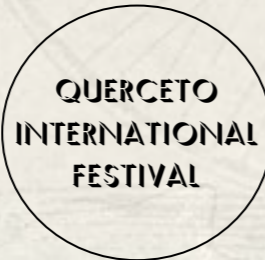
Montecatini (PI) @Querceto International Festival