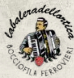
Milano @Balera dell'Ortica VEDI