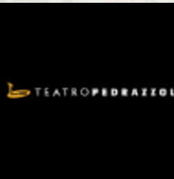
Fabbrico (RE) @Teatro Pedrazzoli VEDI