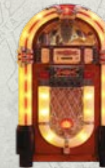
Snow Swing Electro Swing Christmas Mix 2021